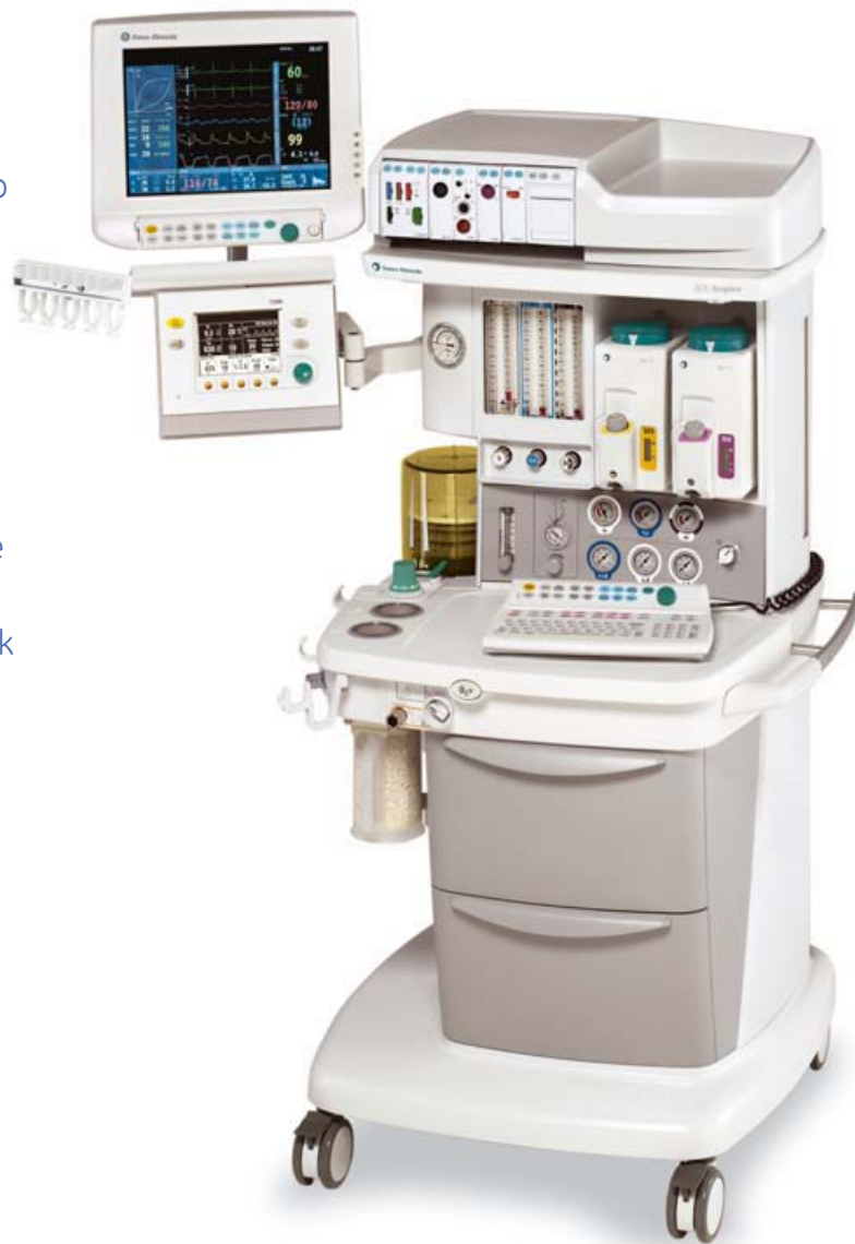
Aparat S/5 Aespire z Monitorem Anestetycznym Datex-Ohmeda i parownikami Tec®7.